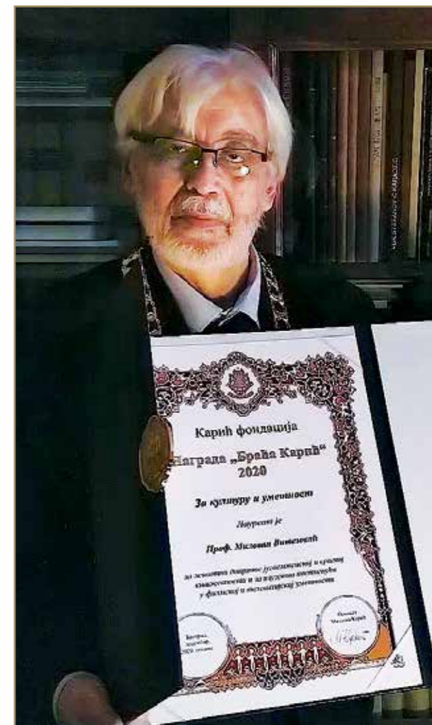
Проф. Милован Витезовић

Витезовићев разнолики и комплексни опус садржи романе, песме, драме, филмске и телевизијске сценарије, књиге за децу, есеје и афоризме. Објавио је четрдесетак књига, у преко двеста издања. Аутор је дванаест бестселер романа међу којима су поред најпопуларнијих Шешира професора Косте Вујића и Лајања на звезде и Симфонија Винавер, Чарапе краља Петра, Хајдук Вељко Петровић, Милена из Кнез Михаилове, Света љубав, Синђелић се са сунцем смирио, Принц Растко, Бурлеска у Паризу, Кад је невен био сунце и Госпођица Десанка. Бројне његове