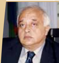
Oblast: kultura i umetnost Eljčin Iljas Efendijev za doprinos književnosti i jačanje prijateljskih i bratskih veza između Srbije i Azerbejdžana