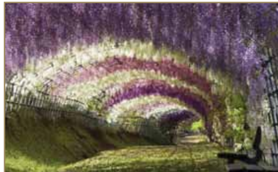
- Tunnel Visterija – Japan

Neka od najlepšim mesta na svetu isključivo su delo prirode. Priroda nam daruje neverovatno lepe kreacije u kojima možemo da uživamo i divimo im se.