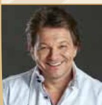
Oblast: Kultura i umetnost Dragan Bjelogrić za izuzetan doprinos filmskoj umetnosti