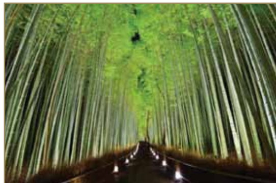
- Tunnel bambusa – Kijoto

Krajem aprila i početkom maja Kavaci Fudži bašta u Japanu postaje magična zemlja vilenjaka. Visterija je loza puzavica čiji je srodnik grašak, a tokom ovog perioda u godini ona je u punom cvatu i stvara ovu predivnu nadstrešnicu koja izgleda kao scena iz bajke.