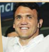
Oblast: Sport Dejan Petković Rambo za izuzetne rezultate u svetskom sportu