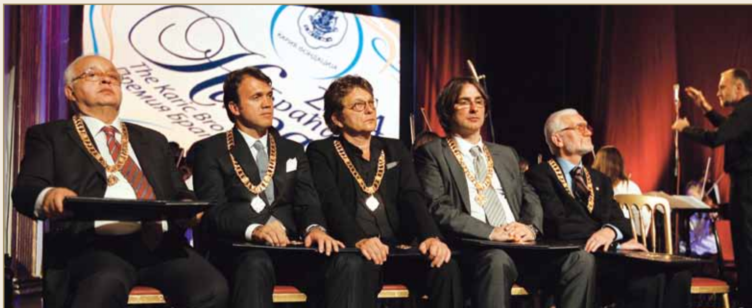
Ovogodišnji dobitnici nagrade „Braća Karić“