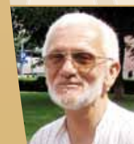
Oblast: Publicistika i izdavaštvo Akademik Ivan Aleksievič Čarota za jačanje kulturnih i duhovnih veza između dva bratska slovenska naroda