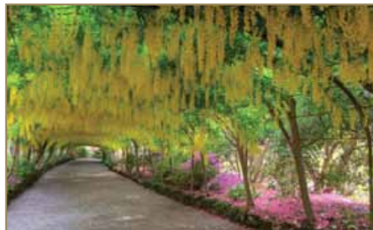
- Nadstrešnica od zlatnih lanaca – Velika Britanija

Ovaj elegantni prirodni tunel formirale su hiljade biljaka bambusa, a prolazi kroz Nebeski hram ili kako ga zovu Tenrudži. Zanimljiv je podatak da je ostatak hrama izgoreo i obnovljen je, a da je tunel ostao netaknut.