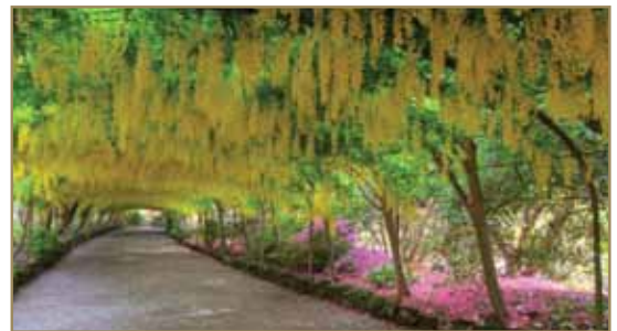
- Надстрешница од златних ланаца – Велика Британија

Овај елегантни природни тунел формирале су хиљаде биљака бамбуса, а пролази кроз Небески храм или како га зову Тенруџи. Занимљив је податак да је остатак храма изгорео и обновљен је, а да је тунел остао нетакнут.