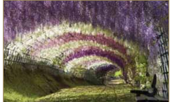
- Тунел Вистерија – Јапан

Нека од најлепшим места на свету искључиво су дело природе. Природа нам дарује невероватно лепе креације у којима можемо да уживамо И дивимо им се.