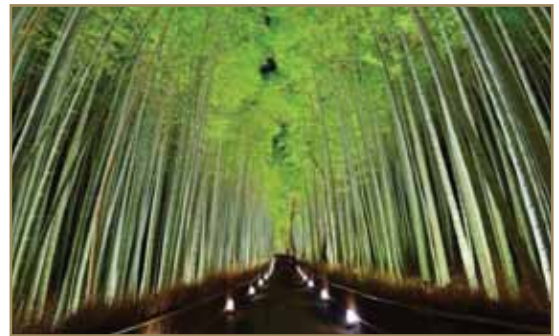
- Тунел бамбуса – Кјото

Крајем априла и почетком маја Каваџи Фуџи башта у Јапану постаје магична земља вилењака. Вистерија је лоза пузавица чији је сродник грашак, а током овог периода у години она је у пуном цвату и ствара ову предивну надстрешницу која изгледа као сцена из бајке.