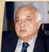
Област: култура и уметност Ељчин Иљас Ефендијев за допринос књижевности и јачање пријатељских и братских веза између Србије и Азербејџана